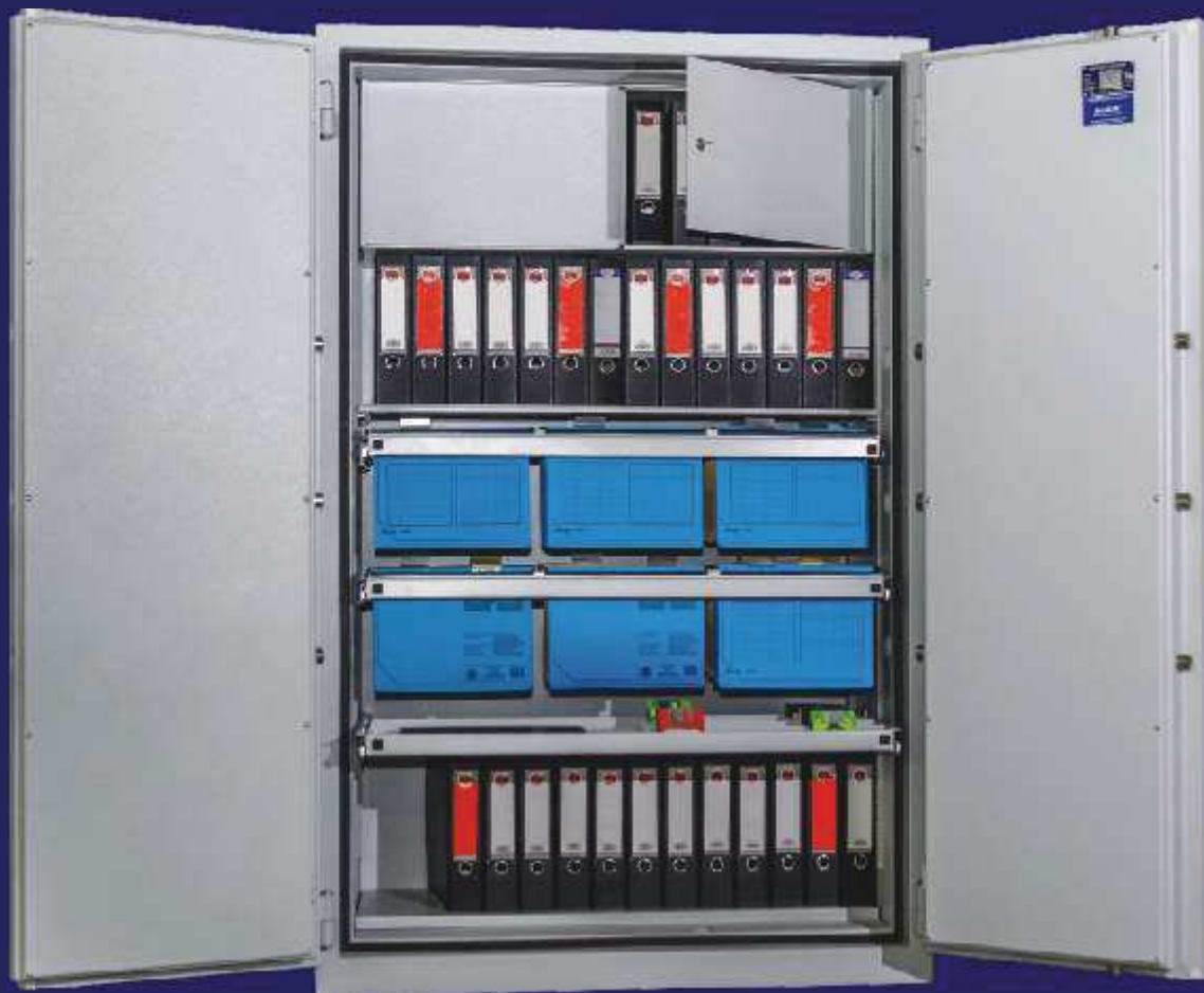
Baugröße BS 6

Großvolumige Dokumententresore für Buchhaltung, Archivierung und Top-Secret-Unterlagen