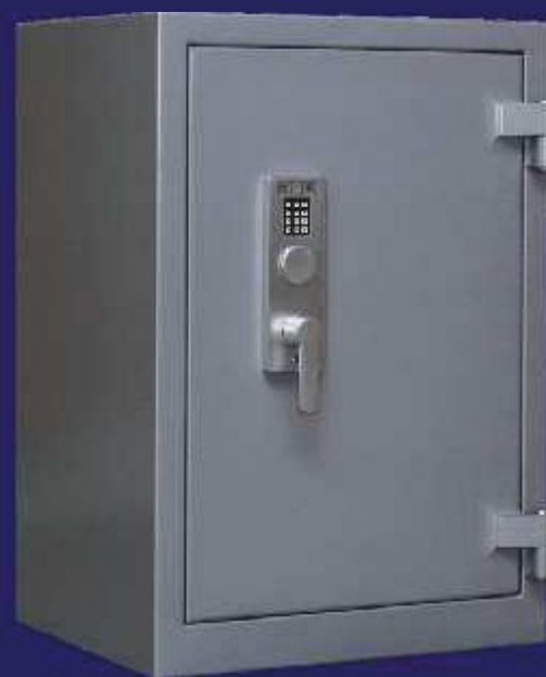
Baugröße BS 2

Großvolumige Dokumententresore für Buchhaltung, Archivierung und Top-Secret-Unterlagen