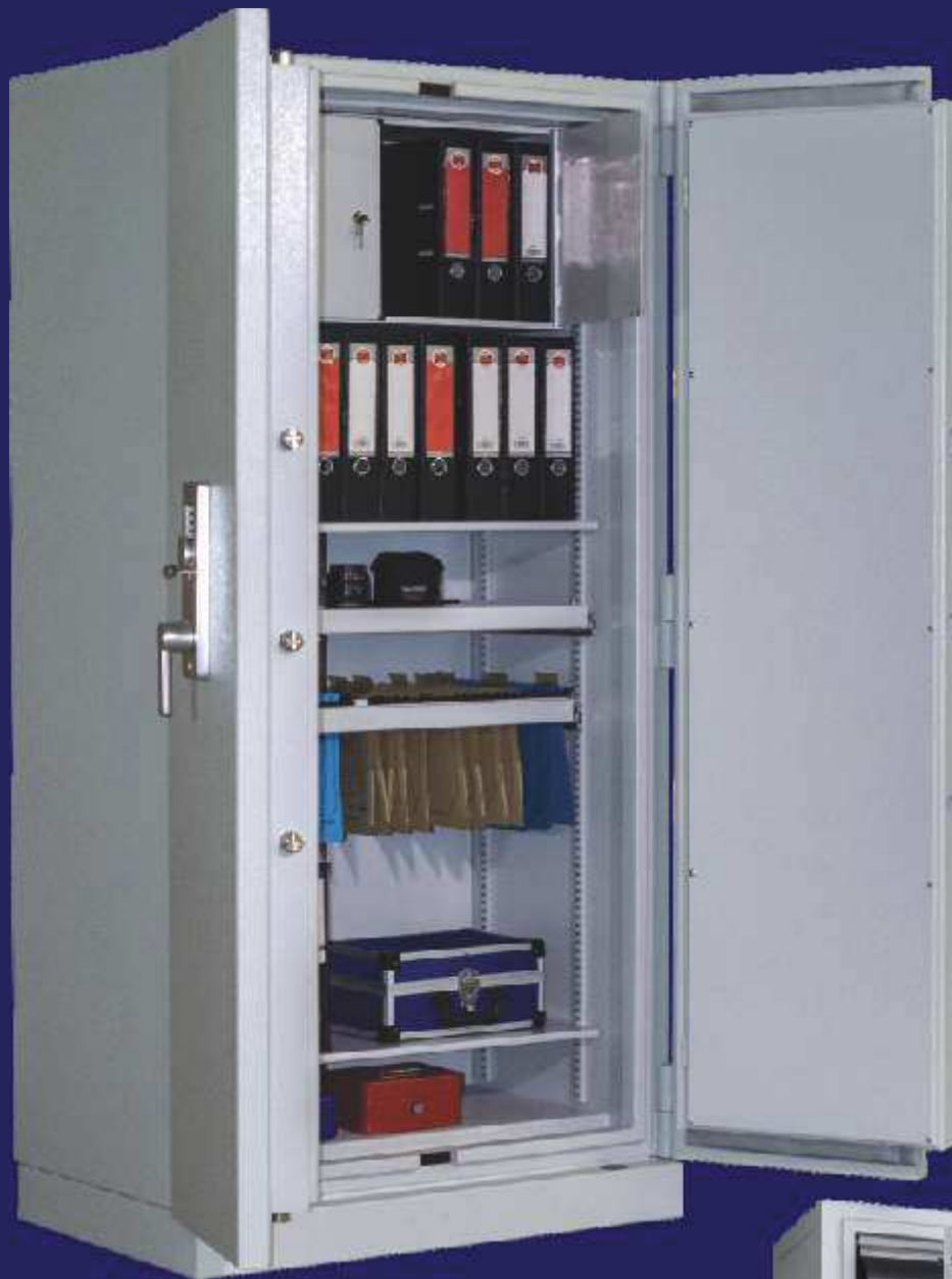
Baugröße B1F 195 plus

EINBRUCHSCHUTZ und FEUERSCHUTZ für Datenträger aus Papier