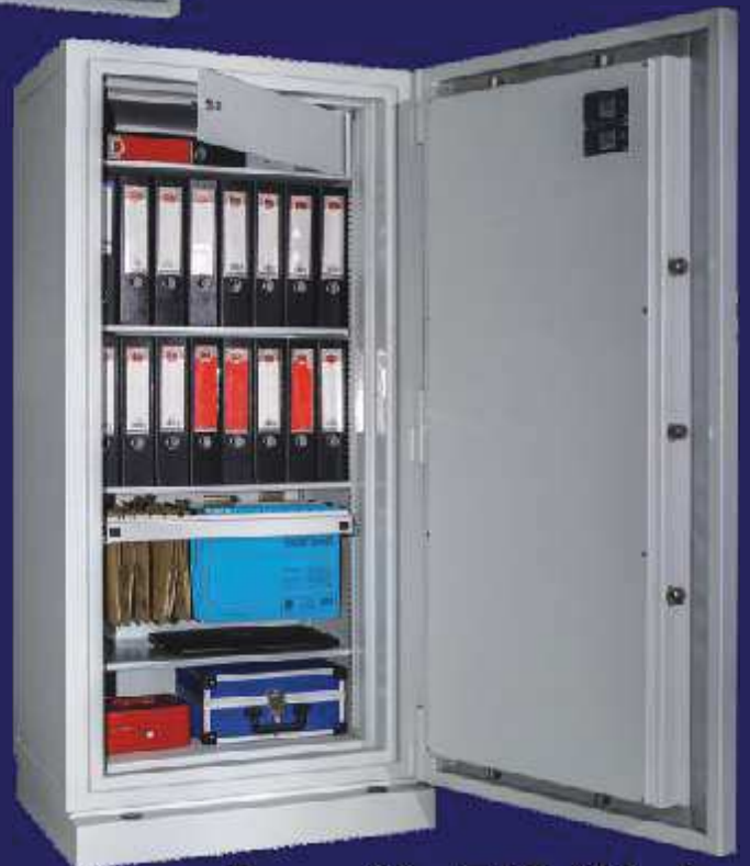
Baugröße B1F 165 plus

Typengeprüfter Feuerschutz S 60 P nach EN 1047-1