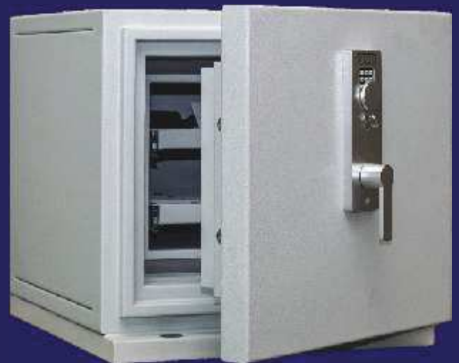
Baugröße DTF plus