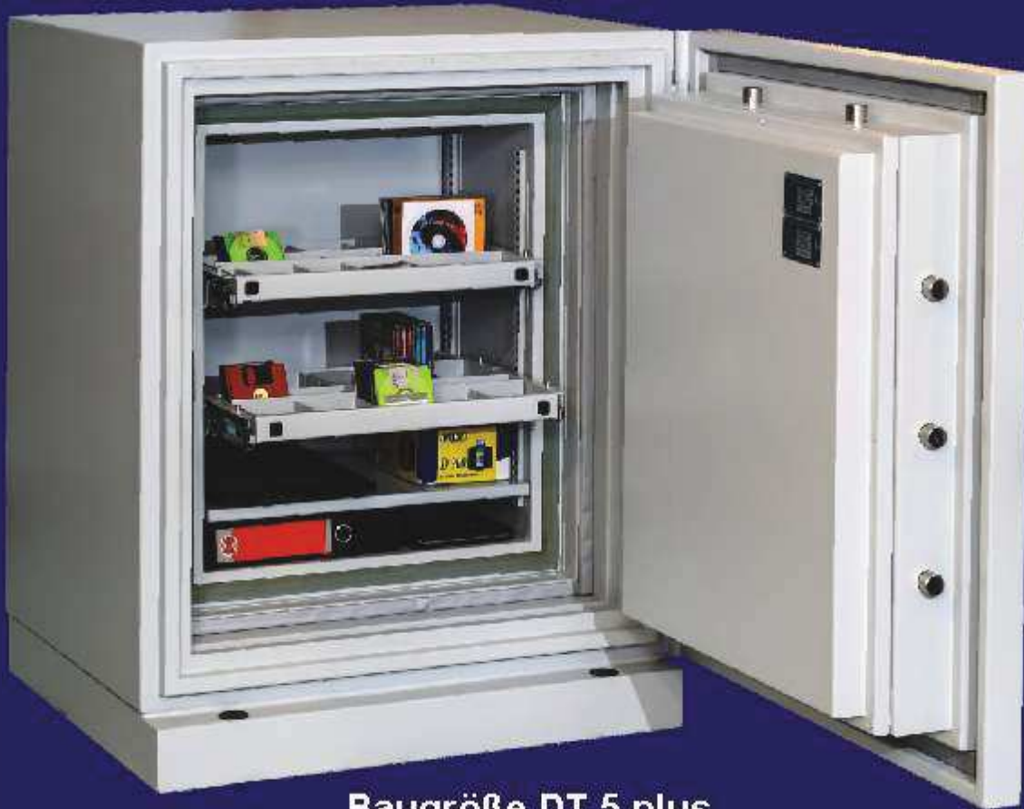
Baugröße DT 5 plus

Klassischer Datensicherungs- schrank zum Einsatz in EDV-Abteilungen, zur Einlagerung aller Datenträger, zur Archivierung externer Festplatten, Cds, DVDs, Magnetbänder und Datensticks.